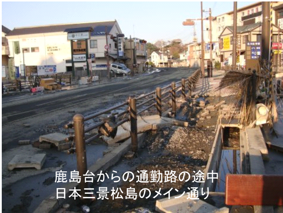
鹿島台からの通勤路の途中 日本三景松島のメイン通り