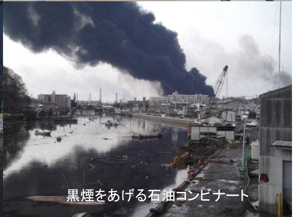
黒煙をあげる石油コンビナート