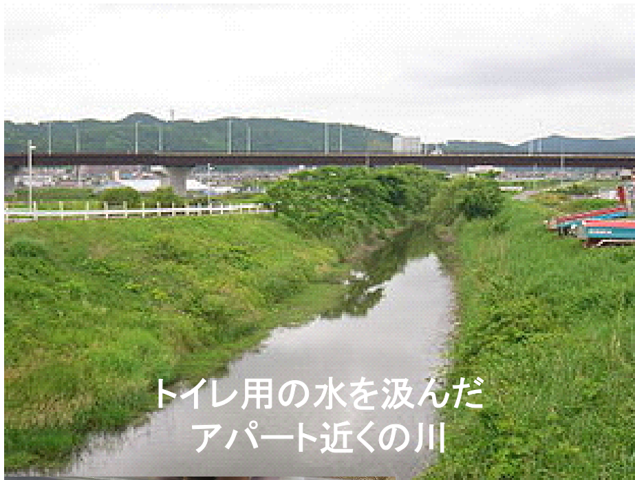
トイレ用の水を汲んだ アパート近くの川