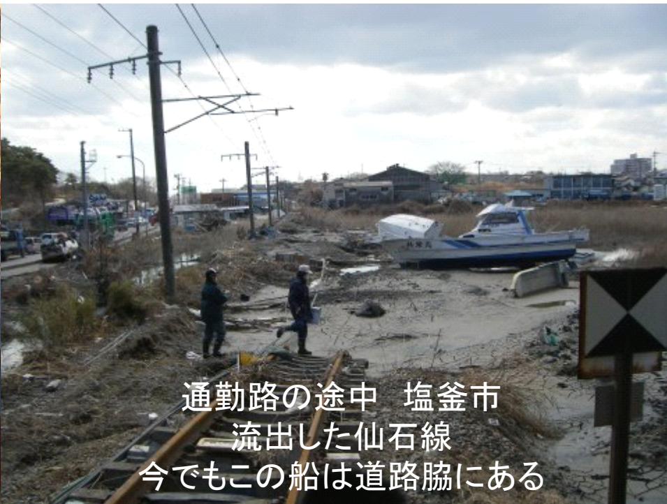
通勤路の途中 塩釜市 流出した仙石線 今でもこの船は道路脇にある