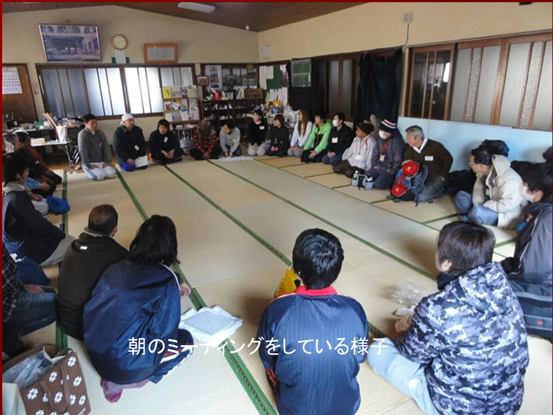
朝のミーティングをしている様子