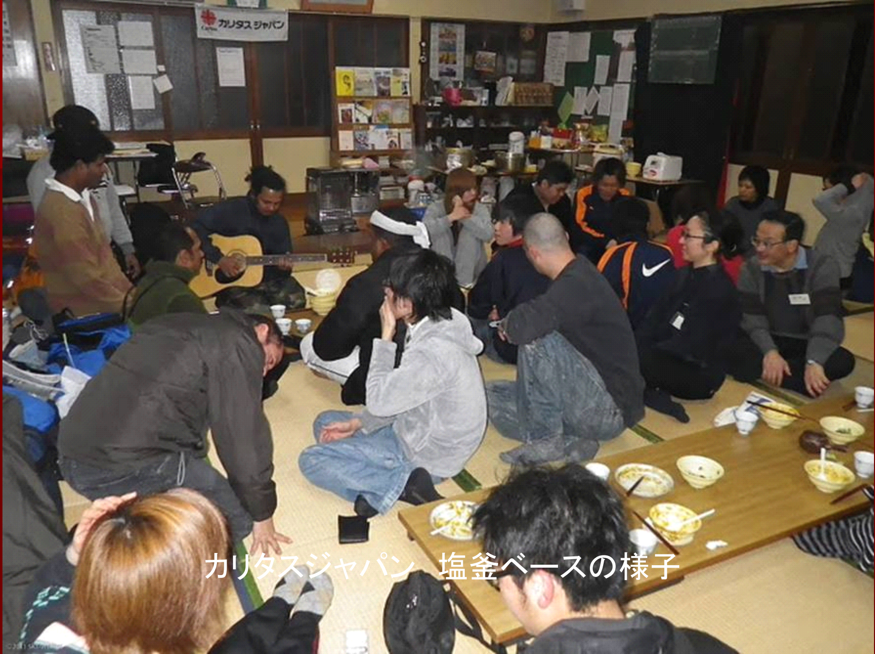
カリタスジャパン 塩釜ベースの様子