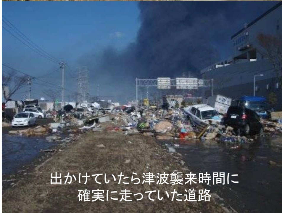
出かけていたら津波襲来時間に 確実に走っていた道路