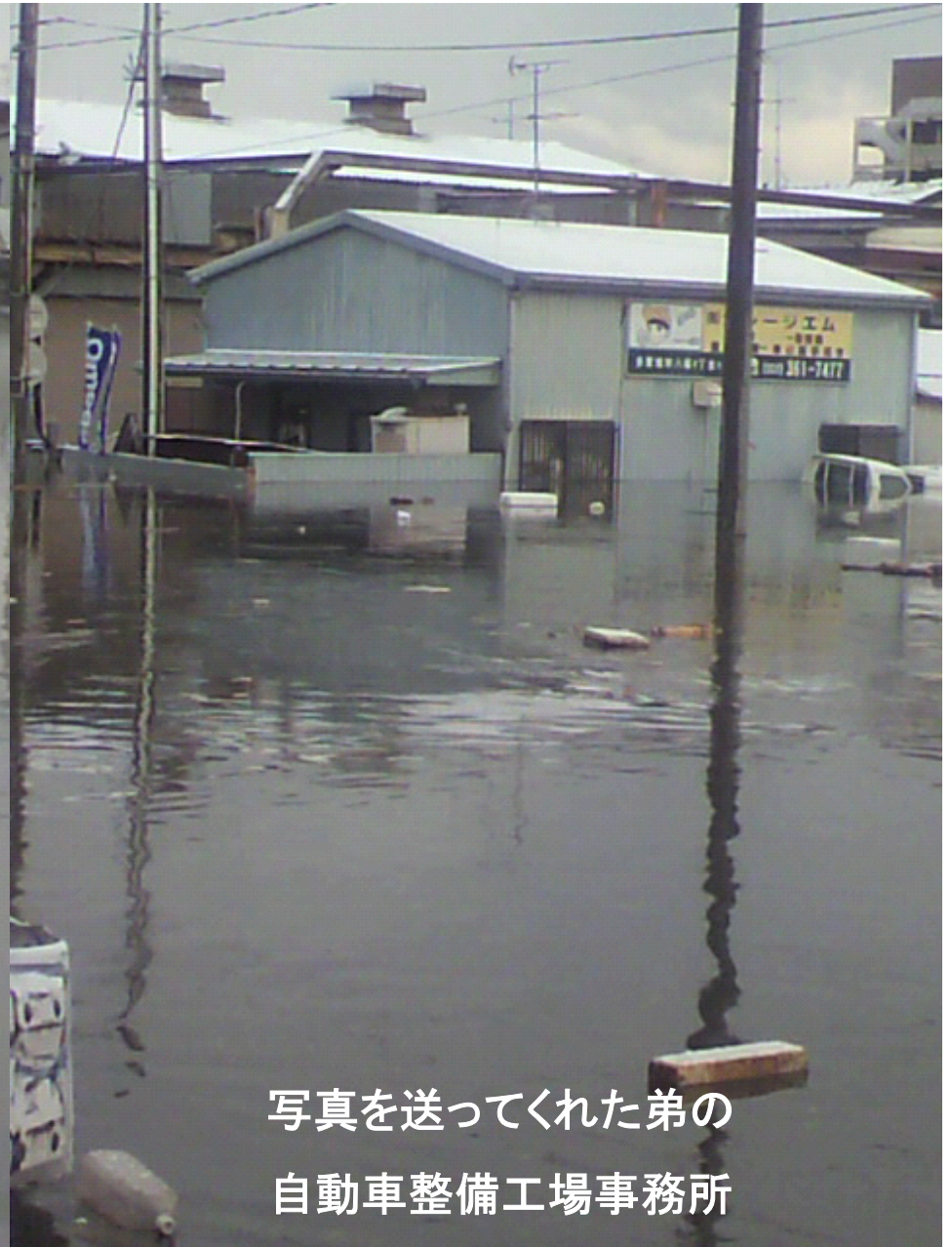
写真を送ってくれた弟の 自動車整備工場事務所