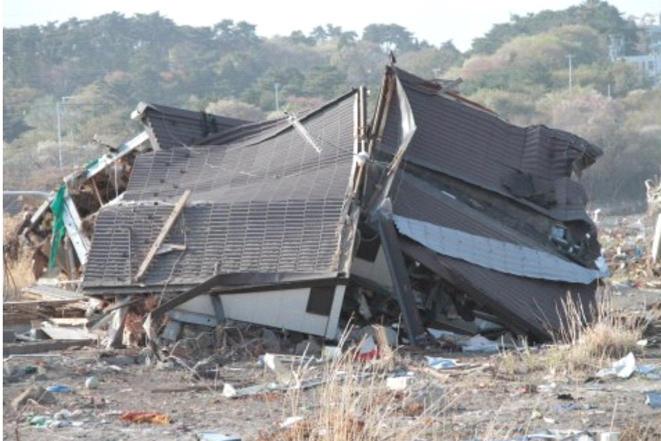
初めて間近に見る津波の脅威