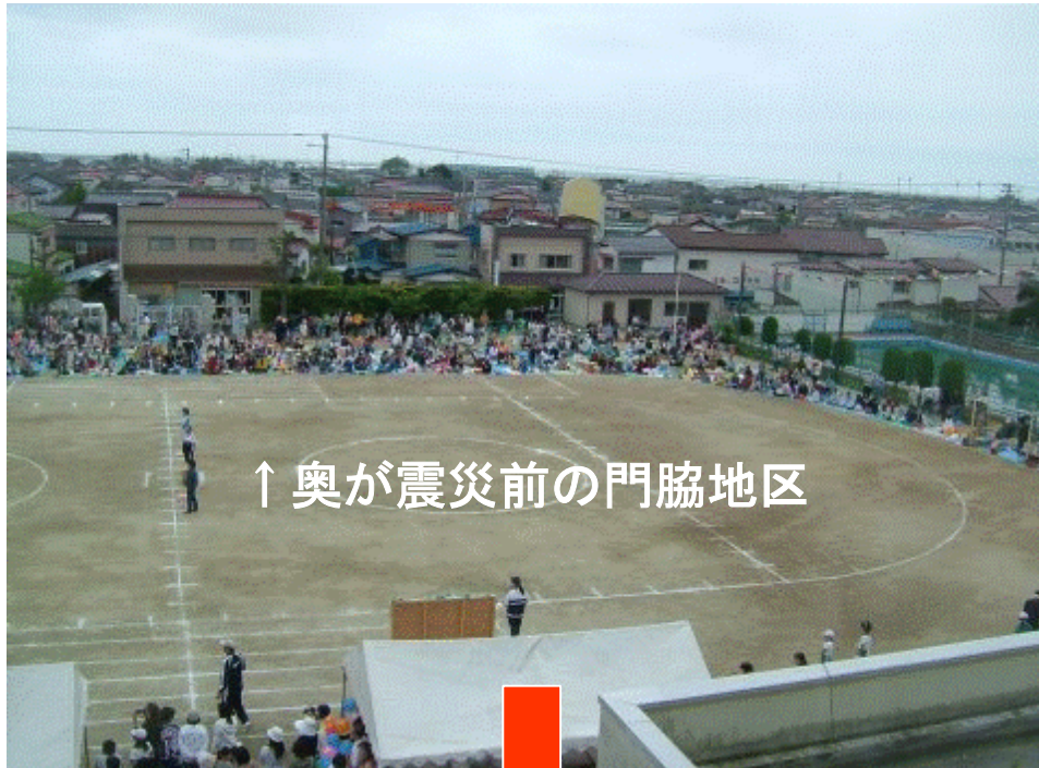
↑ 奥が震災前の門脇地区