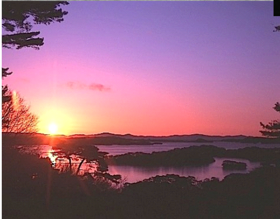
震災後、朝、通勤途中に 車から見える松島の風景