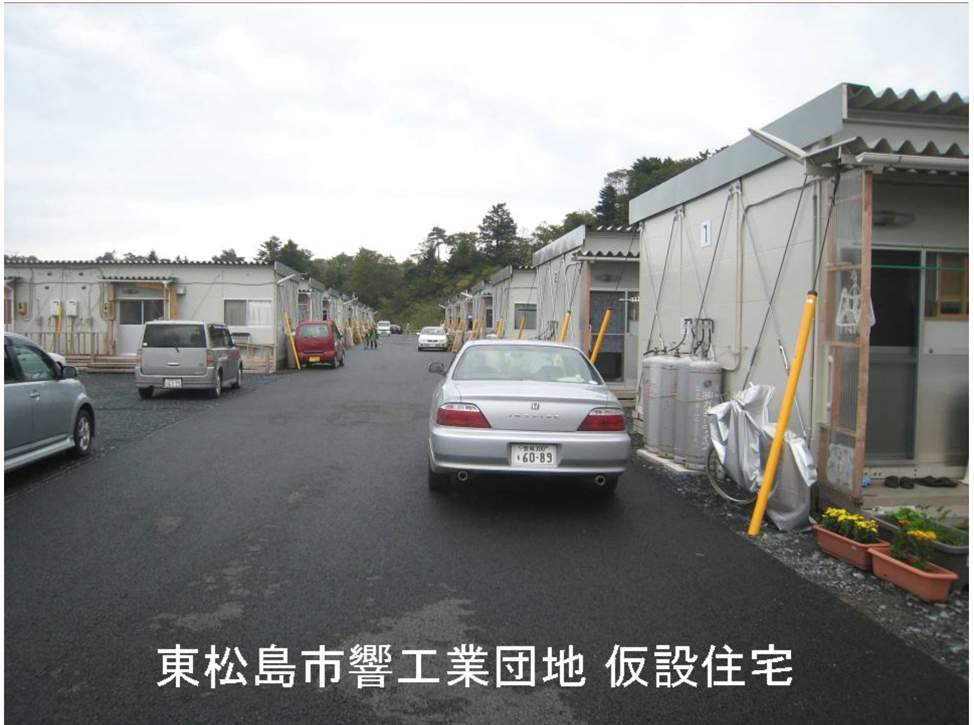
東松島市響工業団地 仮設住宅