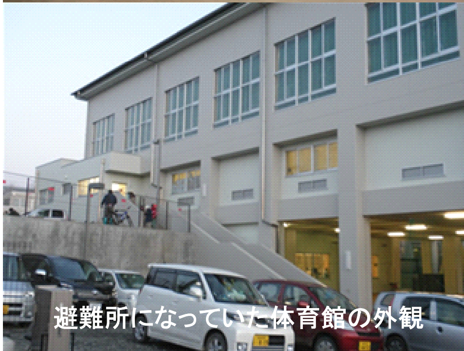
避難所になっていた体育館の外観