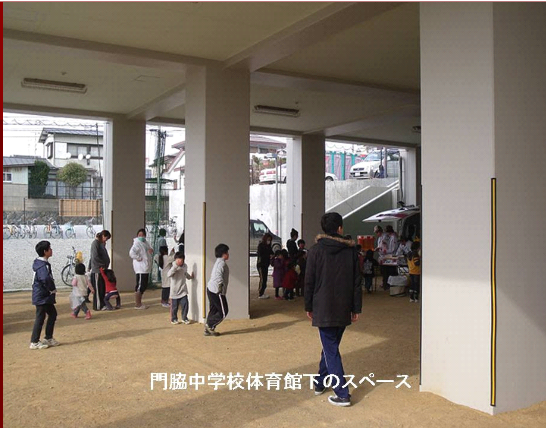
門脇中学校体育館下のスペース