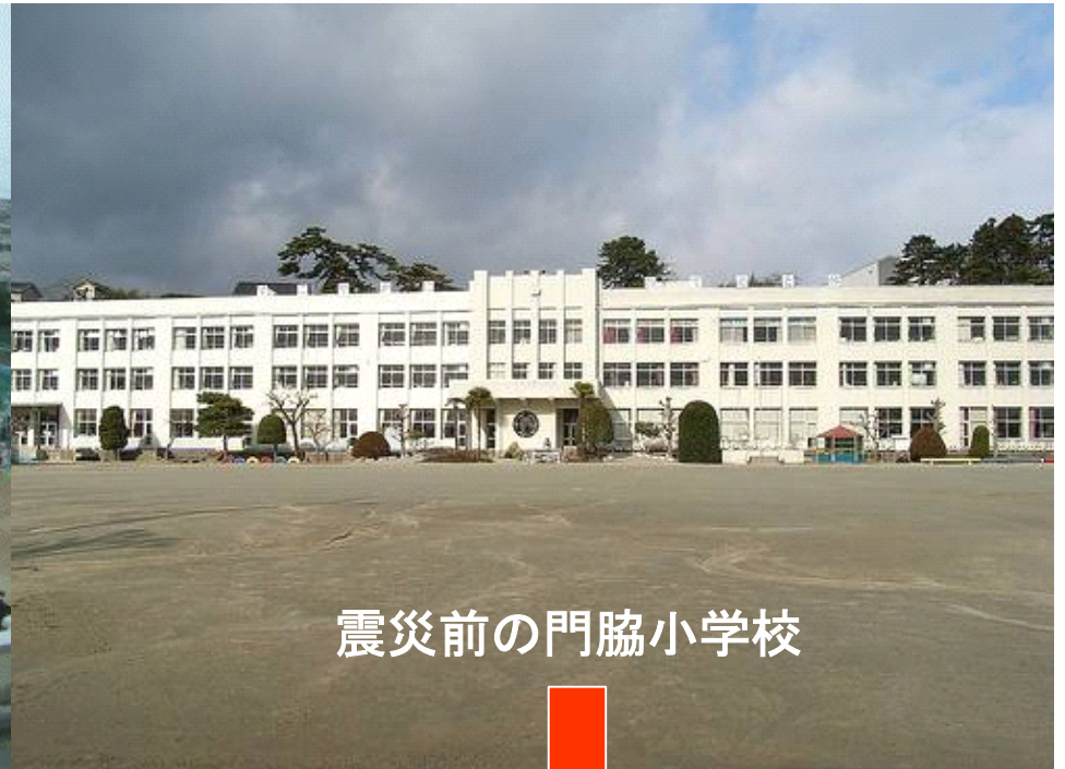
震災前の門脇小学校