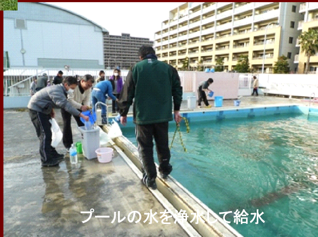
プールの水を浄水して給水