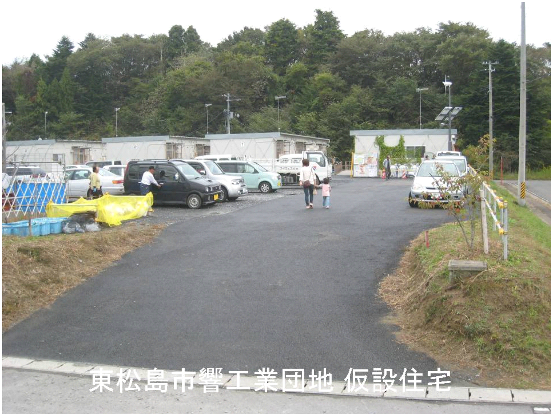
東松島市響工業団地 仮設住宅