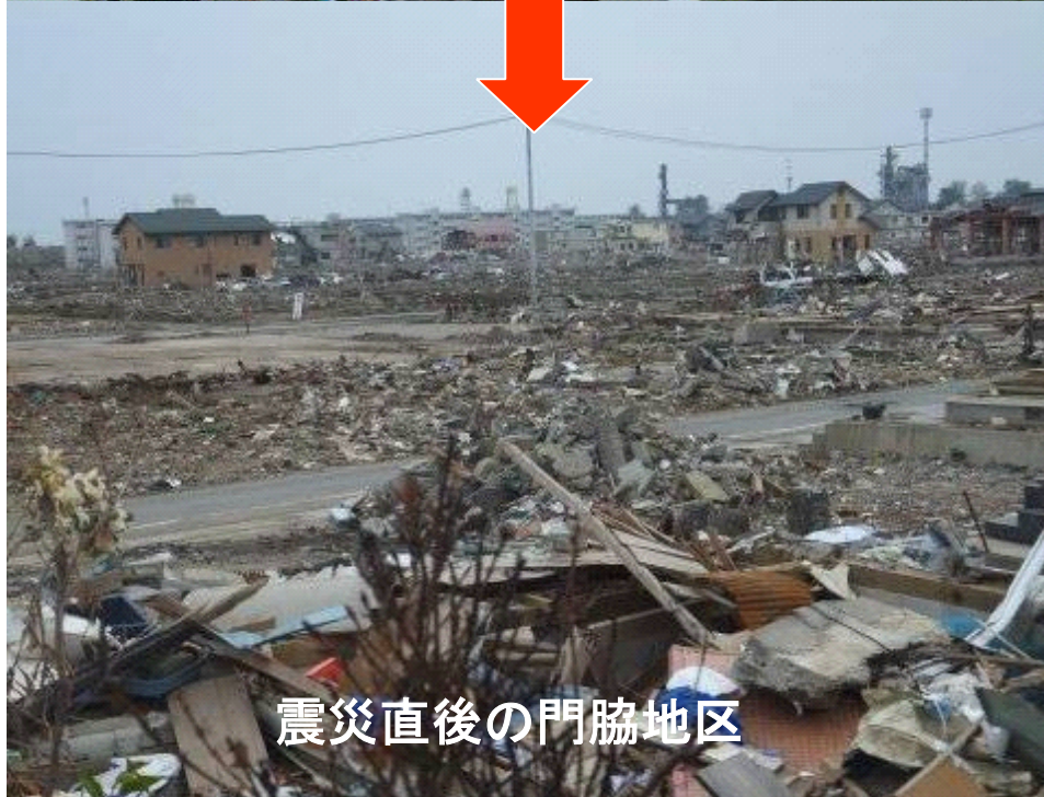
震災直後の門脇地区