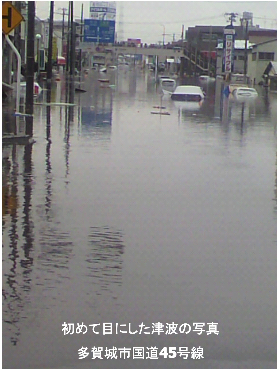
初めて目にした津波の写真 多賀城市国道45号線