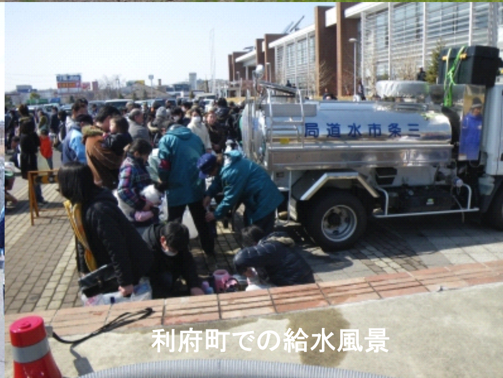
利府町での給水風景