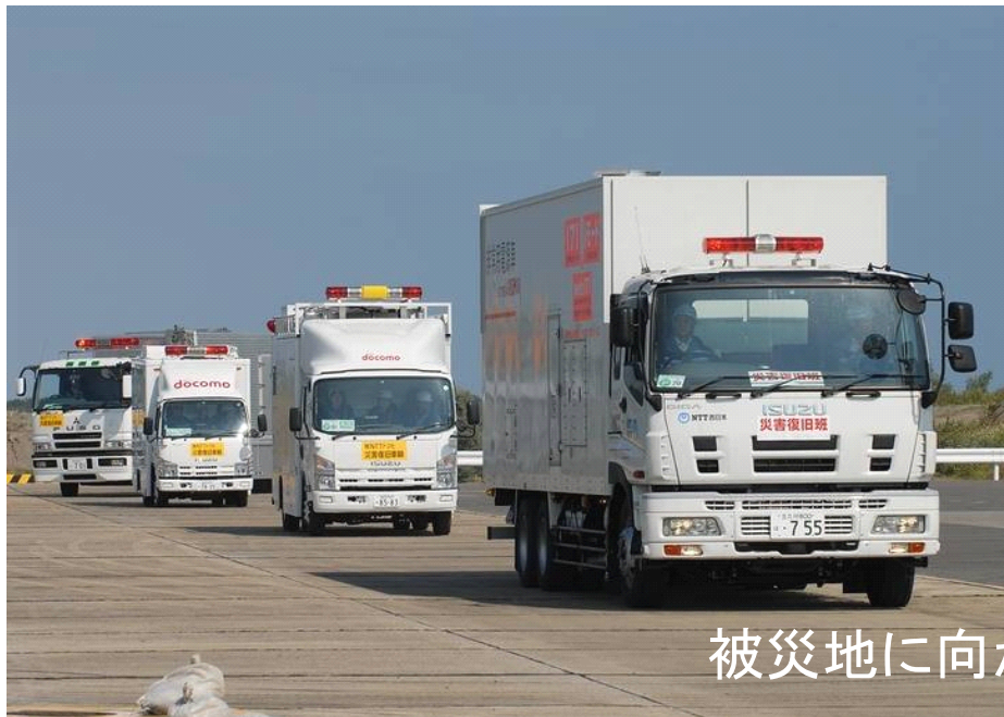
被災地に向かう救援車両