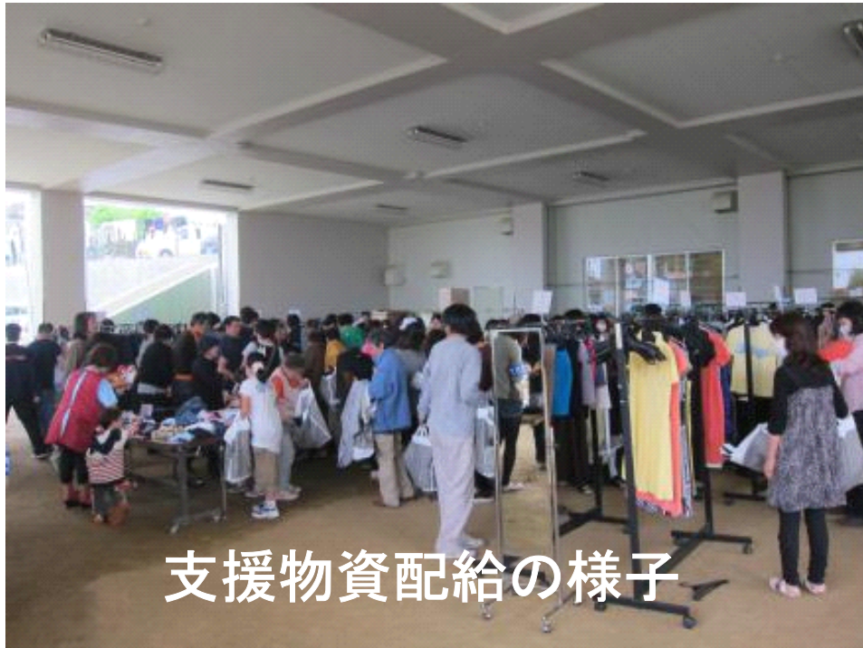
支援物資配給の様子