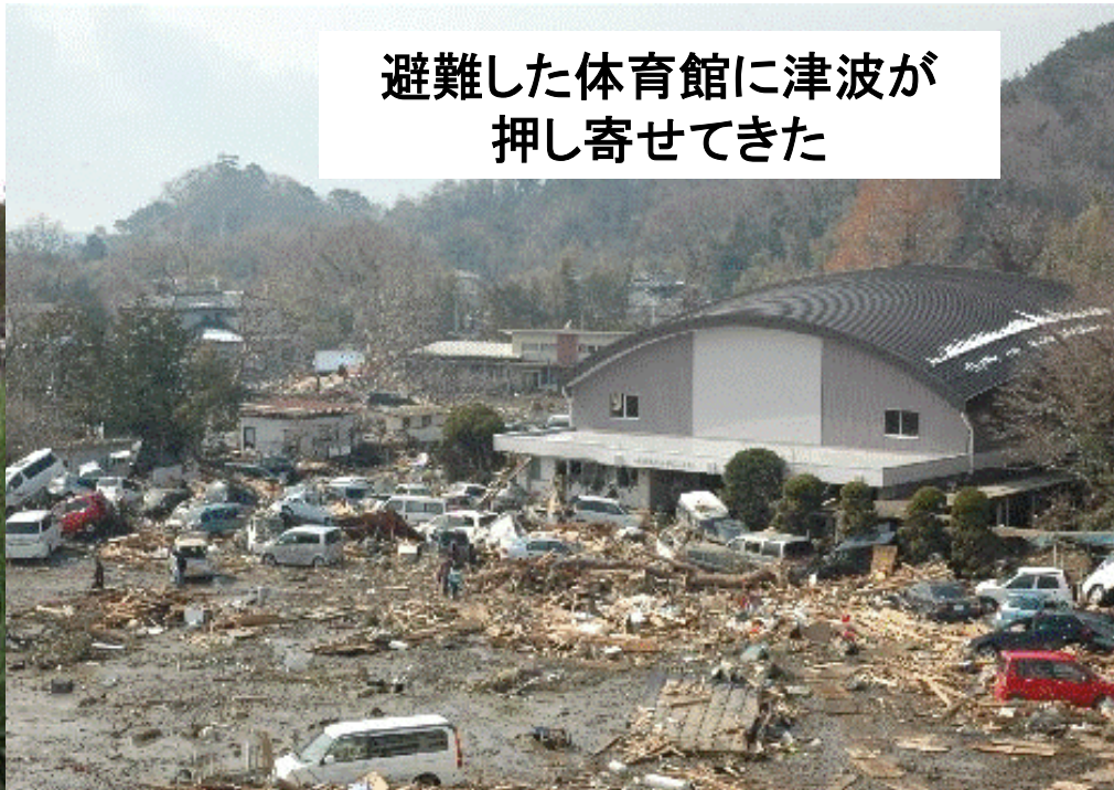
避難した体育館に津波が押し寄せてきた