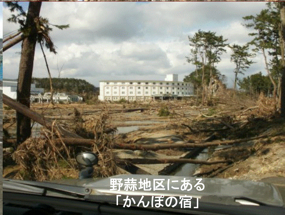
野蒜地区にある「かんぽの宿」