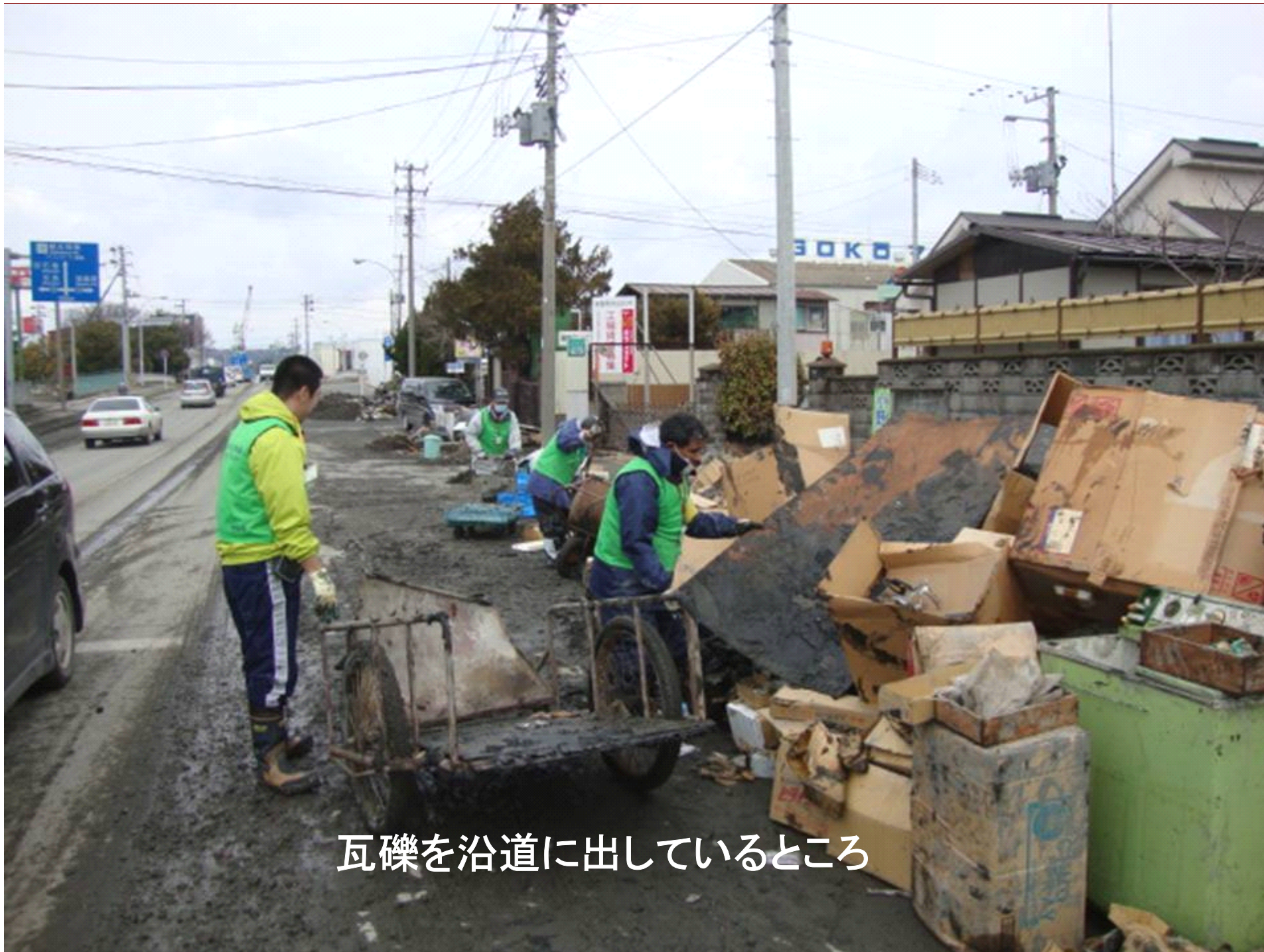
瓦礫を沿道に出しているところ