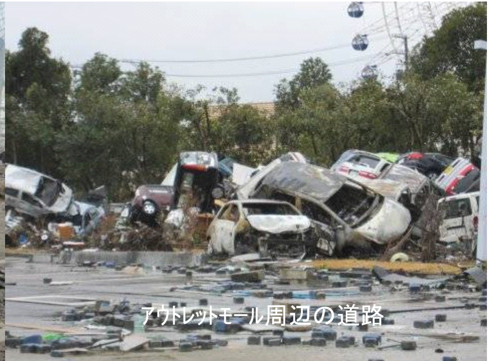
アウトレットモール周辺の道路