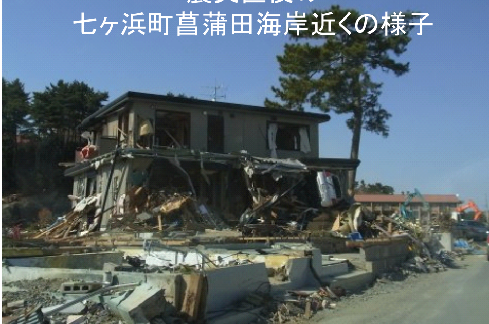
震災直後の 七ヶ浜町菖蒲田海岸近くの様子