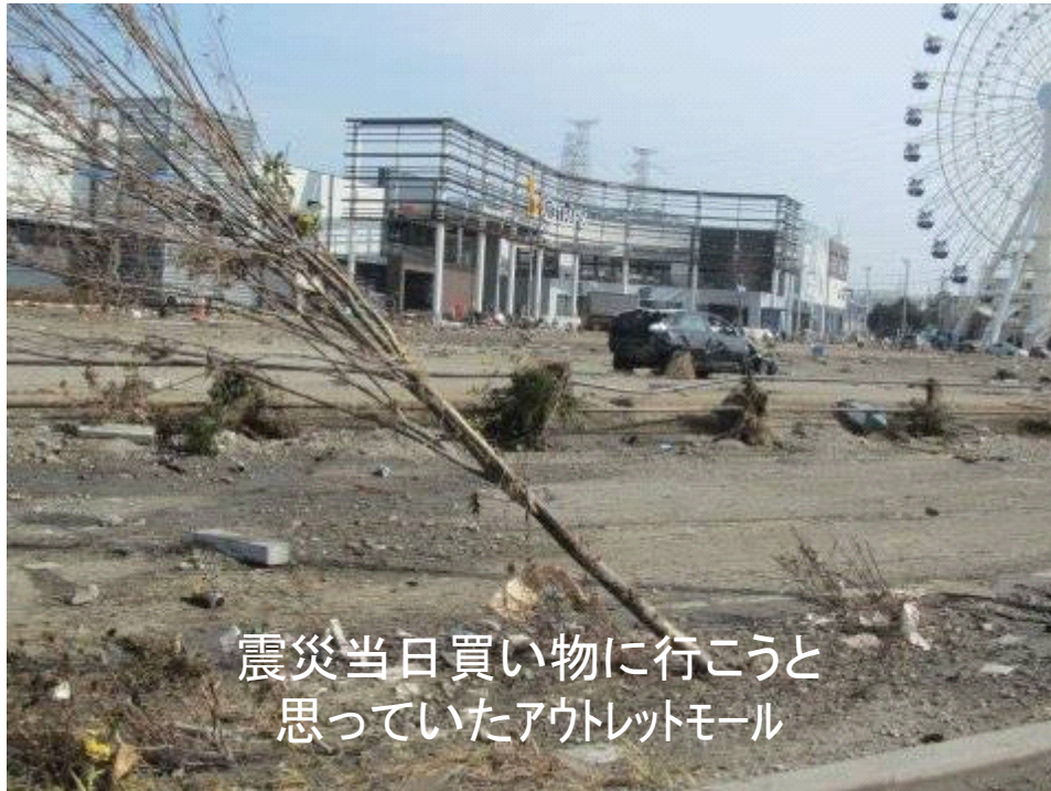
震災当日買い物に行こうと 思っていたアウトレットモール