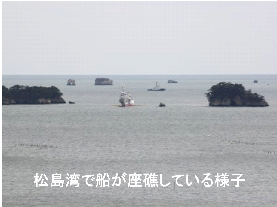
松島湾で船が座礁している様子