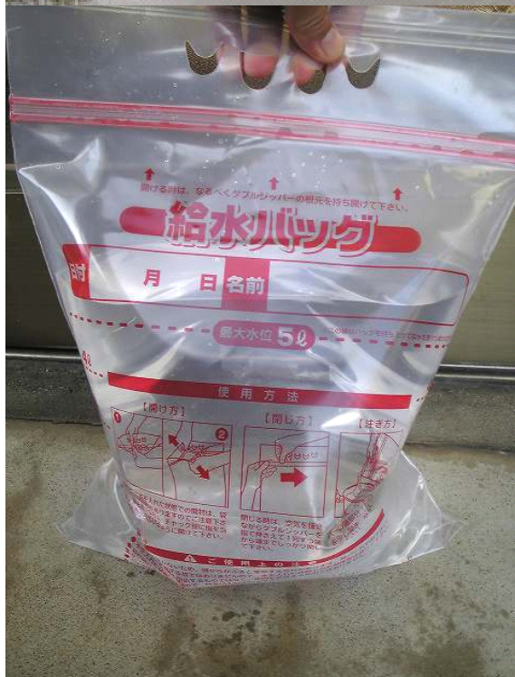
塩釜市で 配布して いたタイプ の給水 バッグ