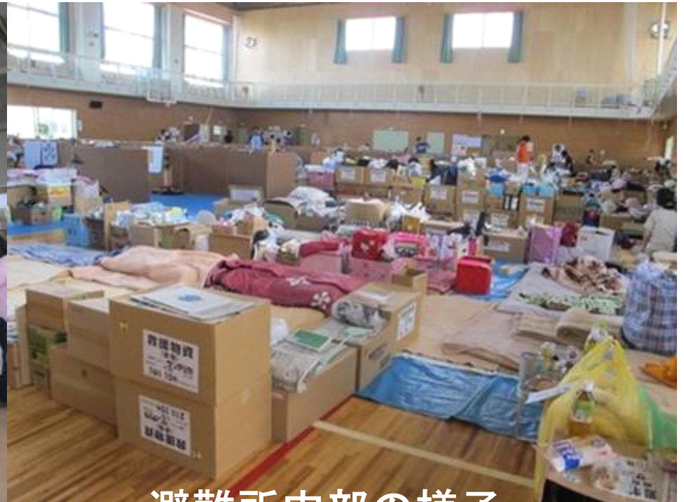
避難所内部の様子