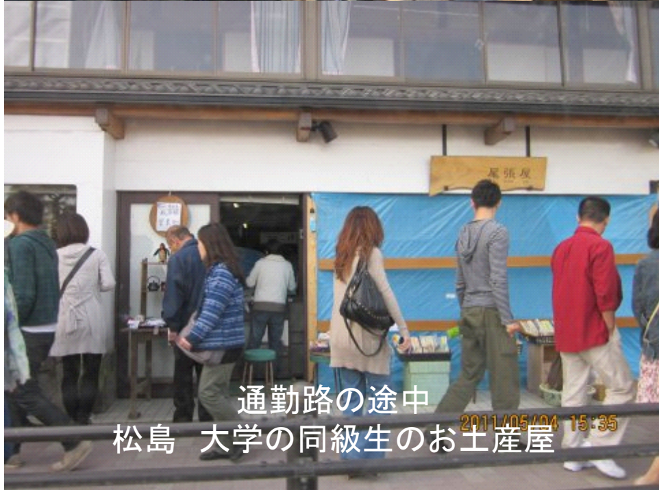
通勤路の途中 松島 大学の同級生のお土産屋 2011/05/04 15:35