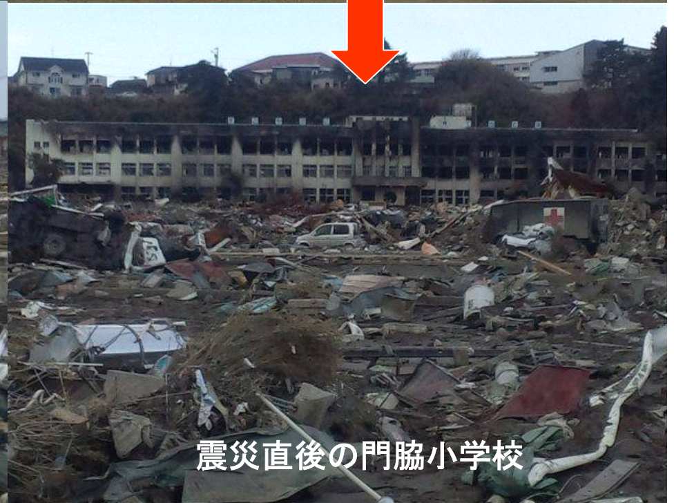
震災直後の門脇小学校