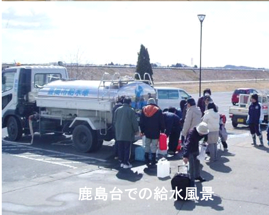
鹿島台での給水風景