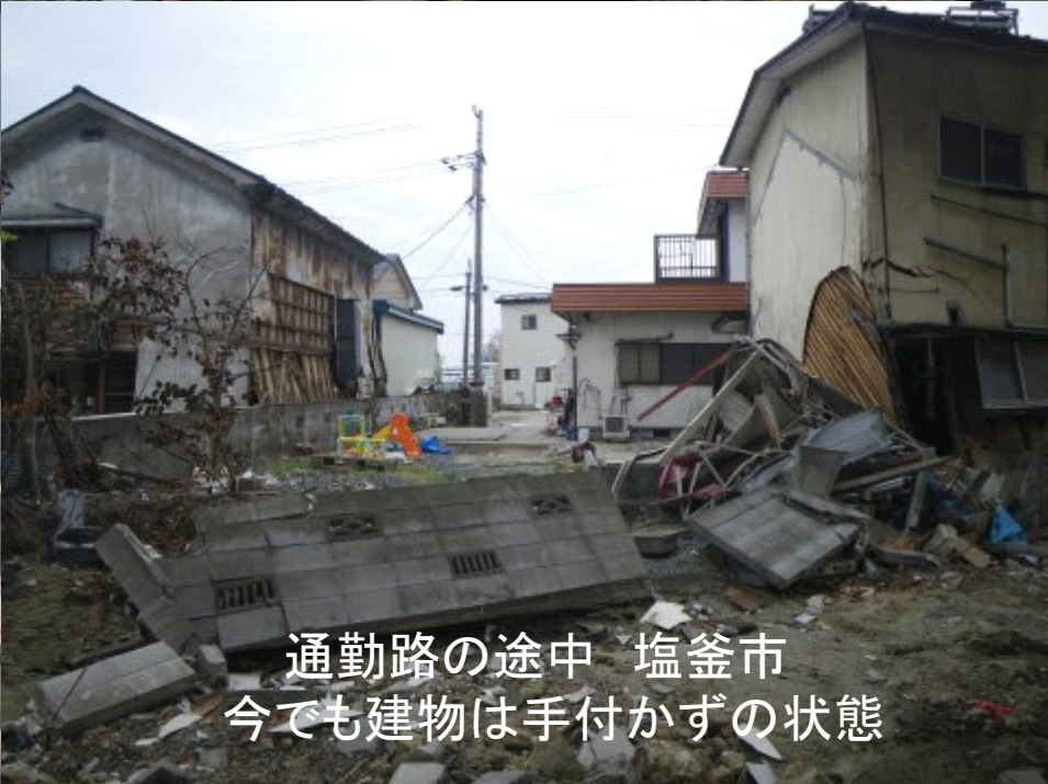
通勤路の途中 塩釜市 今でも建物は手付かずの状態