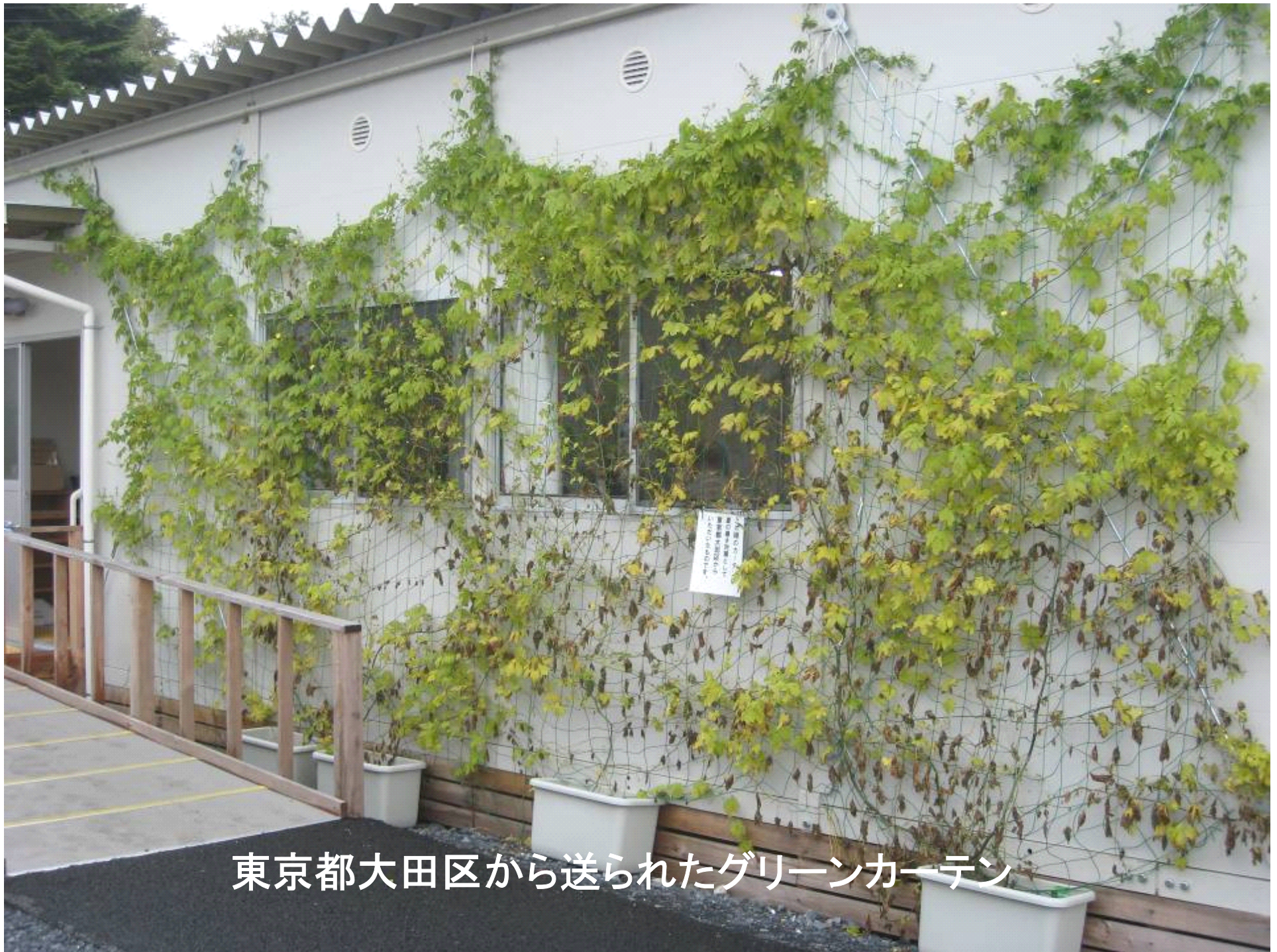
東京都大田区から送られたグリーンカーテン